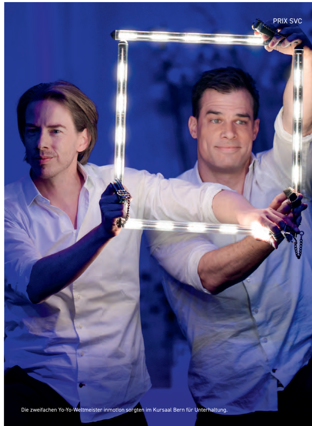
Die zweifachen Yo-Yo-Weltmeister inmotlon sorgten im Kursaal Bern für Unterhaltung.