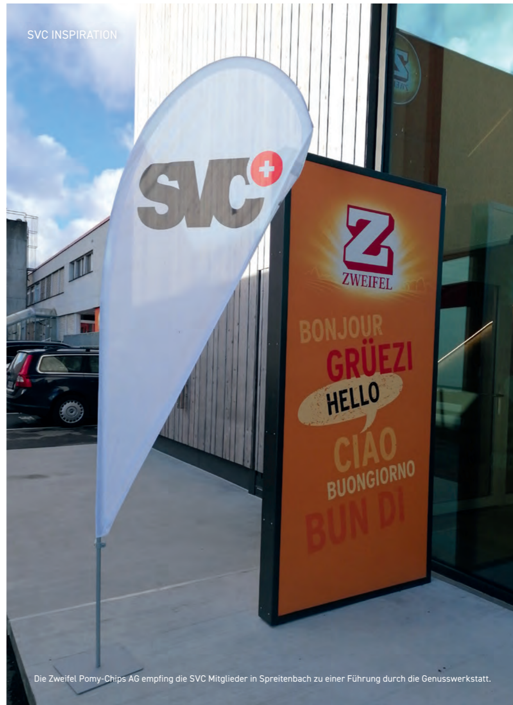
Die Zweifel Pomy-Chips AG empfing die SVC Mitglieder in Spreitenbach zu einer Führung durch die Genusswerkstatt.